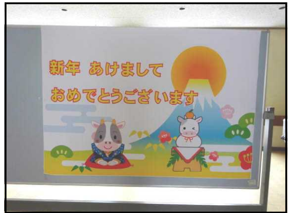
【始業式の朝、児童を迎えたメッセージ】

「一年の計は、元旦にあり」という言葉を聞いたことがある人もいると思います。これは、「何事も最初が大切で、一年間を充実させるためには、年の初めにめあてを決めて取り組むことが大切である」という意味だそうです。