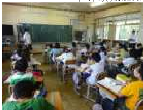
↑ 感染対応しながら学習に取り組んでいます

29日(月)にプール開きを行いました。検診や掃除をはじめ必要な準備を進め今年もプールに水が入りました。プールでも感染防止対応を行いながらの学習となりますが、6年生の代表児童が自分の目標を発表してくれたように、一人一人が目標を持ち積極的に技能を向上させてほしいと思います。