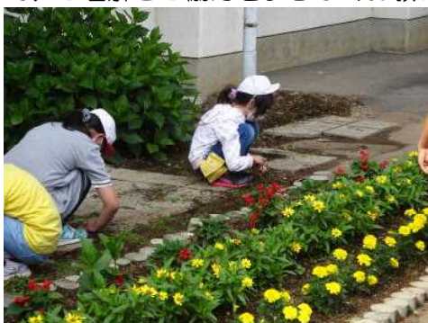
↑ 委員会の活動で花壇が一新しました