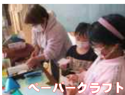
ペーパークラフト